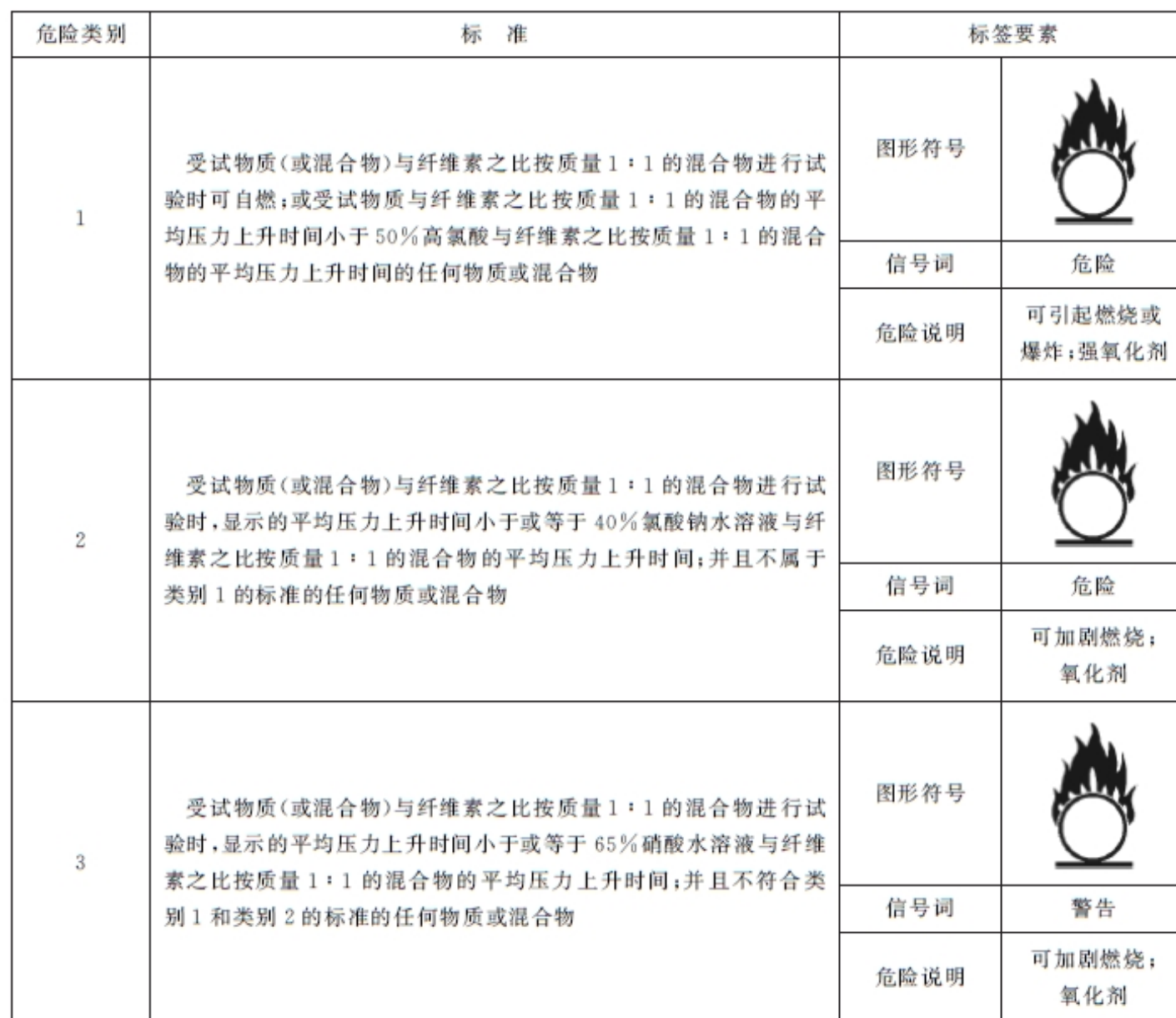
表 C.1 氧化性液体分类标准和标签要素