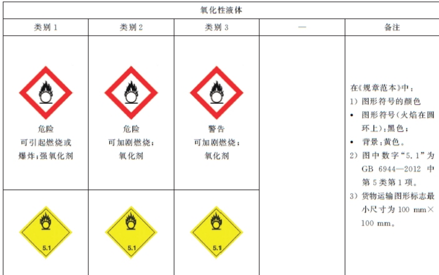
表 B.1 氧化性液体标签要素的分配