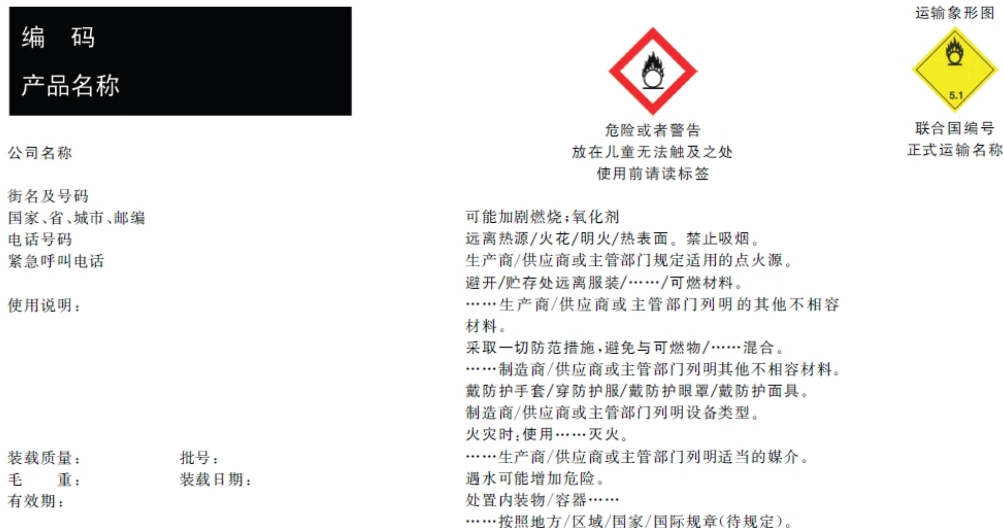
图 E.2 氧化性液体类别 2 和类别 3 的标签