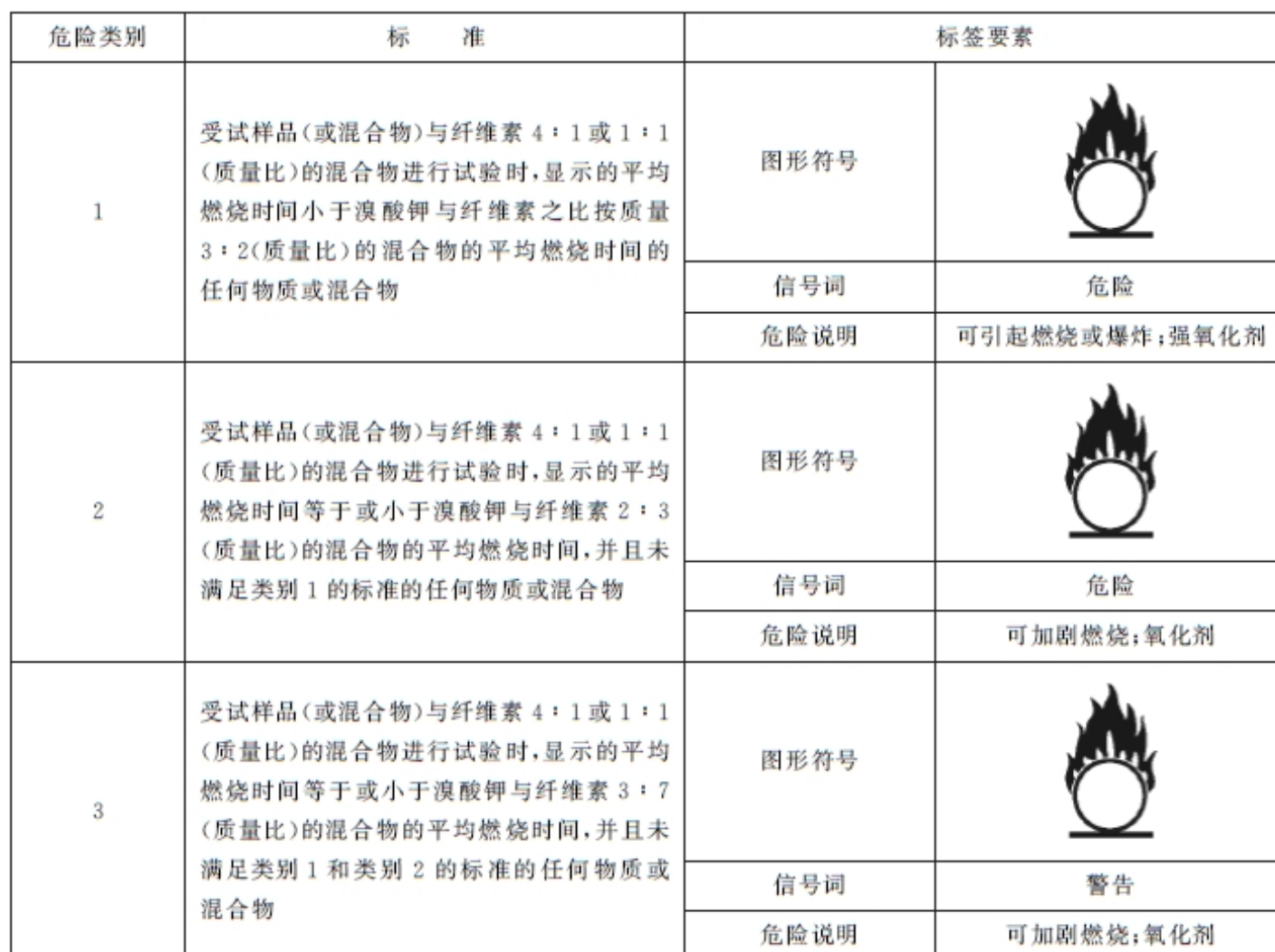
表 C.1 氧化性固体分类标准和标签要素