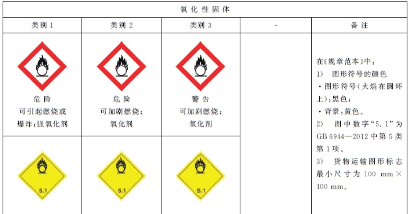
表 B.1 氧化性固体标签要素的分配