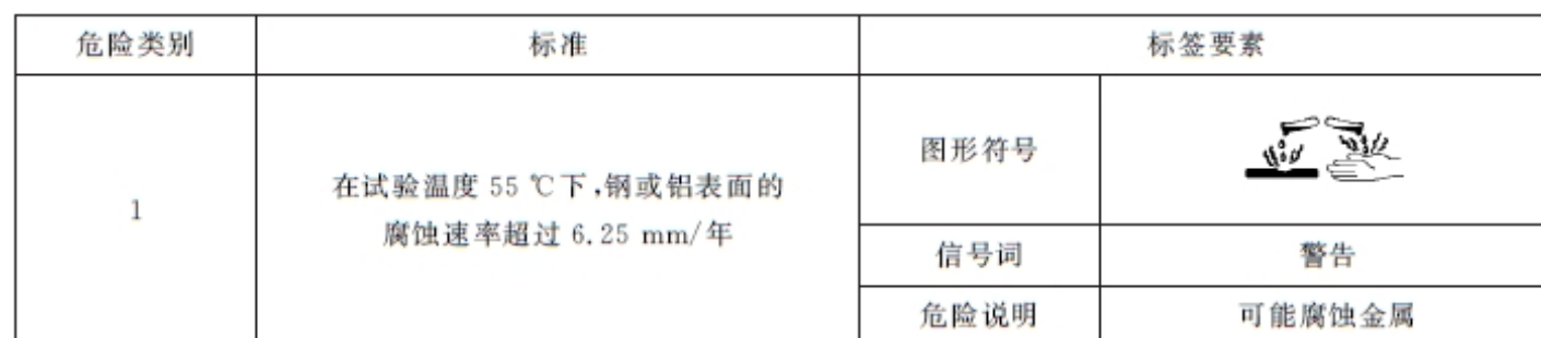
表 C.1 金属腐蚀物类别和标签要素