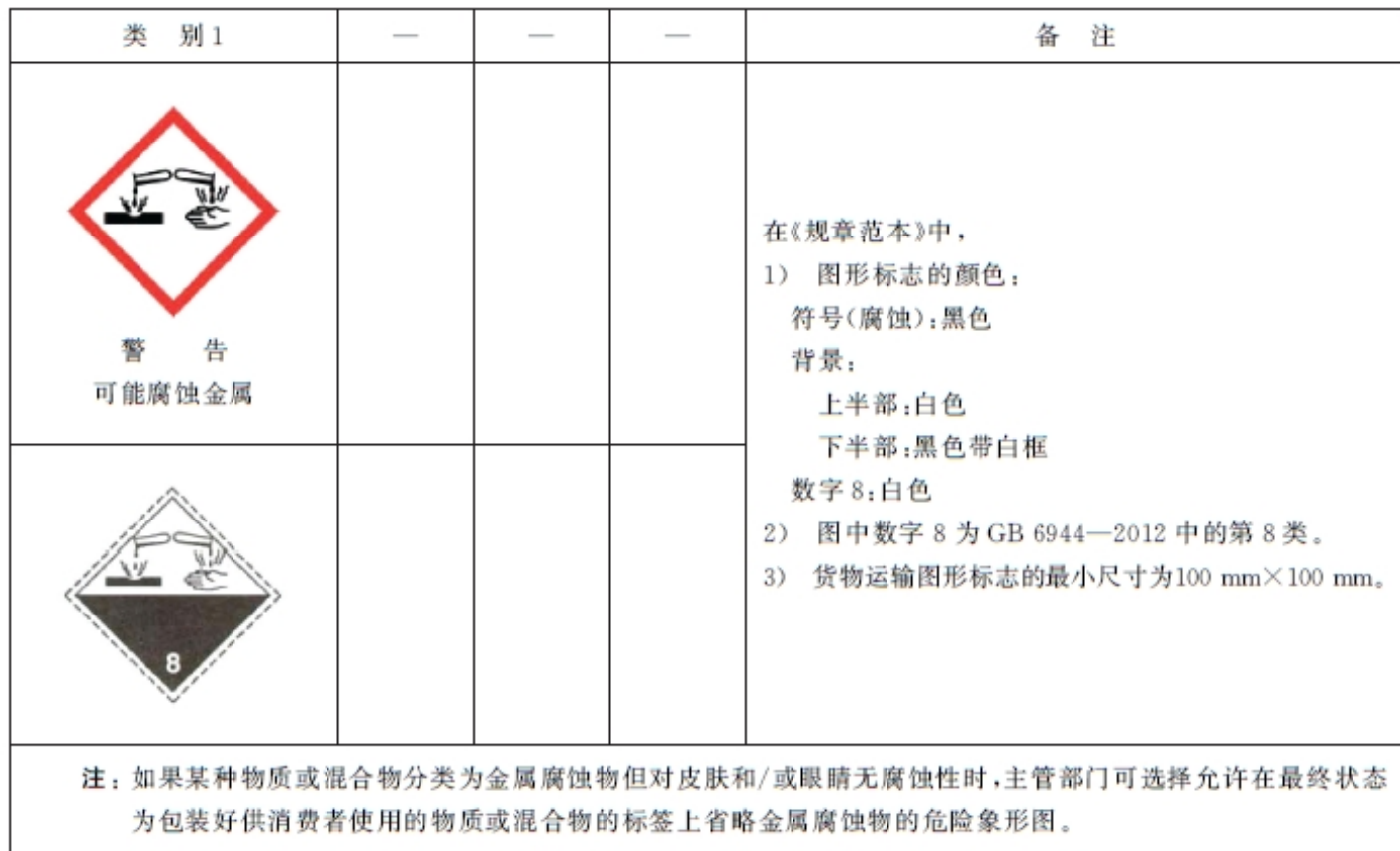
表 B.1 金属腐蚀物标签要素的分配