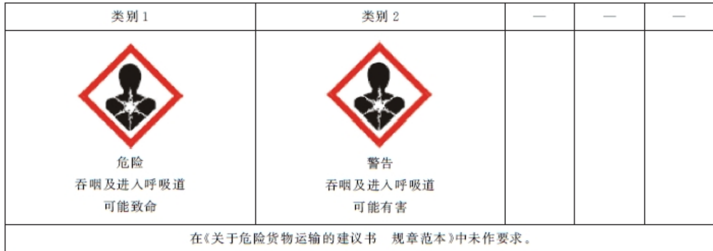
表 C.1 吸入危害的标签要素配置表